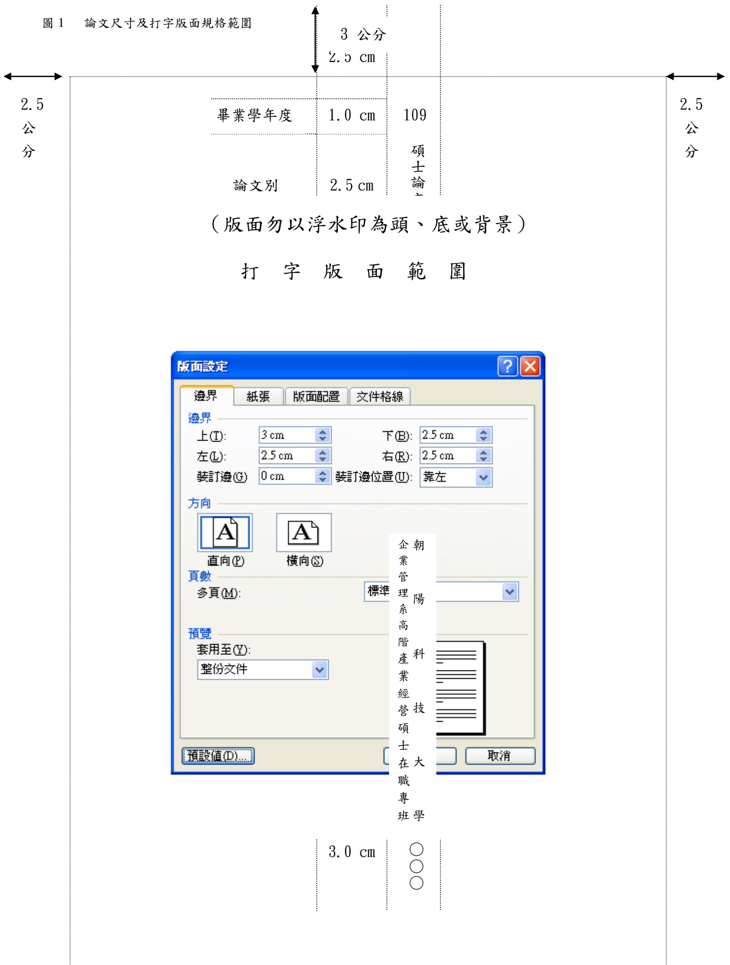
圖 1 論文尺寸及打字版面規格範圍